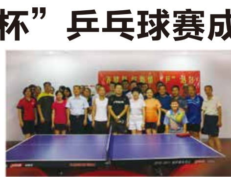
比赛中,运动员们顽强拼搏,勇争第一;裁判员们恪尽职守,公正裁决;承办单位的工

据悉,本次比赛以“齐健身、绽激情、‘乒’活力”为主题,旨在通过此类文体活动丰富兴泰控股广大员工的业余文化生活,增强员工身体素质,强化内部交流与沟通。比赛共设男子单打、女子单打、男子双打、男女混双等四个项目,吸引了来自集团公司及各子公司共计50名运动健将参赛。