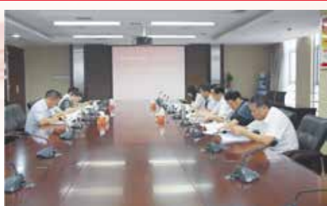
课堂、兴泰书屋上架党建党史读物、开展“制度执行年”、举办廉政文化进企业活动、强化内部

会上,程儒林代表党委班子对年初民主生活会查摆的问题整改情况进行了回顾。程儒林指出,党委高度重视班子存在的“思想解放程度不够、组织生活质量效果有待提升、党建责任落实有待增强”等六大方面的问题,通过深化拓展兴泰